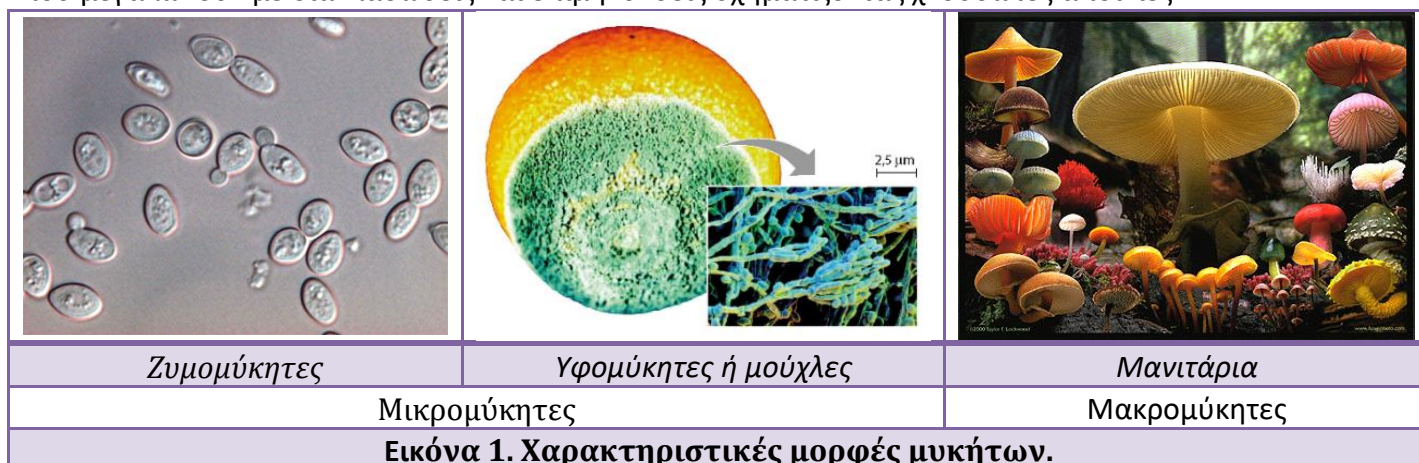
Εικόνα 1. Χαρακτηριστικές μορφές μυκήτων.

Οι μύκητες είναι ευκαρυωτικοί μικροοργανισμοί, είτε μονοκύτταροι είτε πολυκύτταροι με ευρεία εξάπλωση. Τα διάφορα είδη μυκήτων ποικίλλουν μορφολογικά και διακρίνονται σε δύο μεγάλες κατηγορίες: τους μικρομύκητες (ζυμομύκητες και υφομύκητες ή μούχλες) και τους μακρομύκητες (μανιτάρια) (εικόνα 1). Οι ζυμομύκητες είναι σφαιρικοί ή ελλειψοειδείς σχηματισμοί που αναπαράγονται είτε με απλή διχοτόμηση του κυττάρου τους, είτε με εκβλάστηση (ένα εξόγκωμα σε κάποιο σημείο του κυττάρου, το εκβλάστημα ), ενώ οι υφομύκητες αποτελούνται από κυλινδρικούς σχηματισμούς, τις υφές , που μεγαλώνουν με διακλαδώσεις και επιμηκύνσεις σχηματίζοντας χνουδωτές αποικίες.