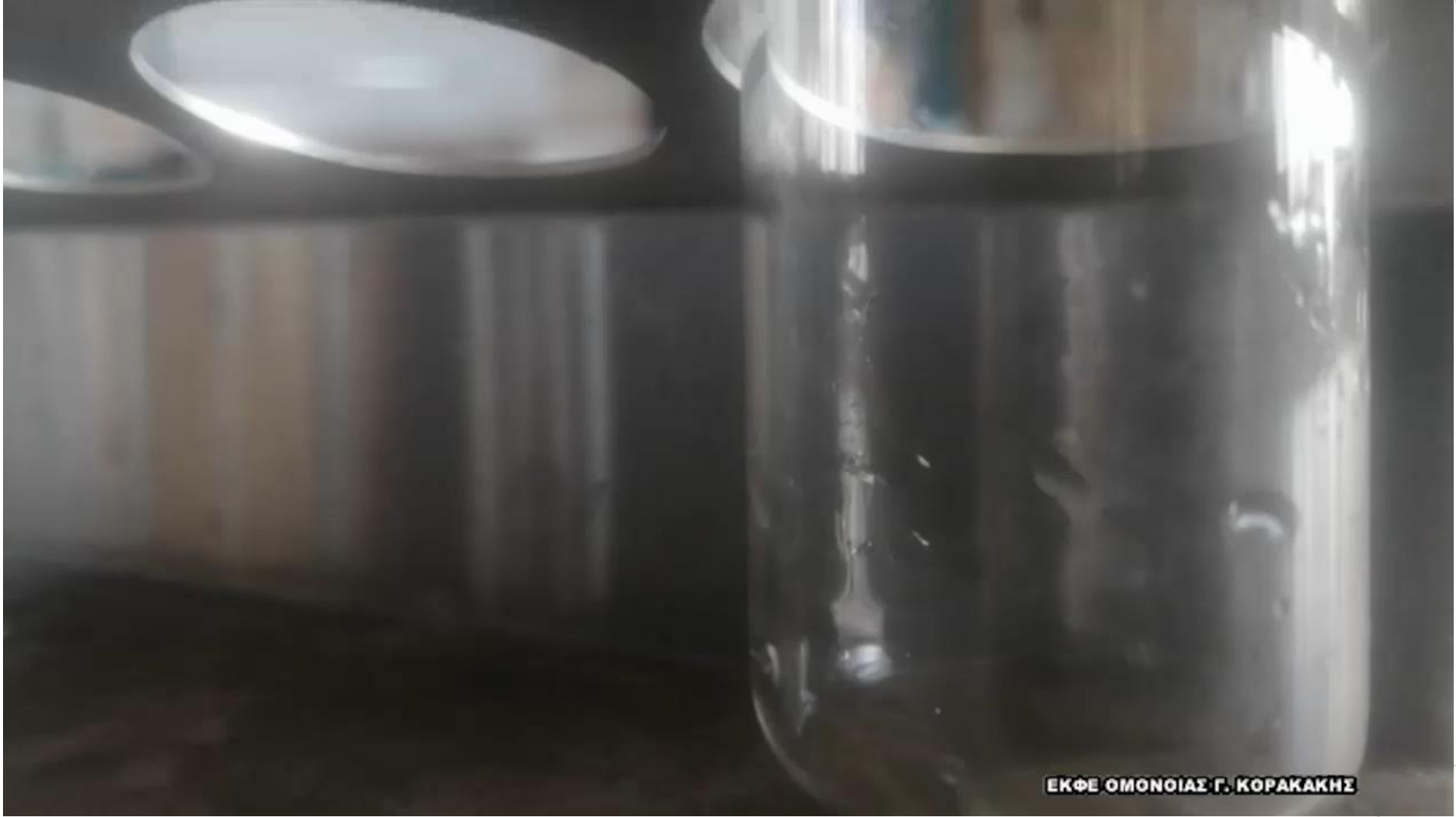
ΕΚΦΕ ΟΜΟΝΟΙΑΣ Γ. ΚΟΡΑΚΑΚΗΣ